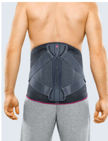
Прямой покрой бандажа

Прямой покрой рекомендован во всех случаях, когда P < W , а также при отсутствии большой разницы между окружностью на уровне тазовых костей P и окружностью талии W (менее 3 см).