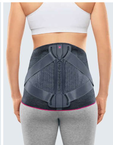
Приталенный покрой бандажа